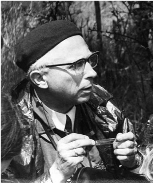
Auf zoologischer Exkursion mit Studenten im Mai 1970. Man beachte Feldstecher, Exhaustor, Lupe... und Krawatte.