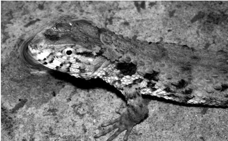
Abbildung 4: Der erste Vertreter der bislang nur aus China bekannten Krokodilschwanz-Höckerechse, Shinisaurus crocodilurus , aus Nordvietnam.

Sammeln von Fröschen, Schildkröten und Schlangen für chinesische Märkte, aber auch für den Internationalen Tierhandel, wo attraktiv aussehende Frösche (z.B. Theioderma spp.), Schildkröten (z.B. Cuora spp.) oder Echsen (z.B. Goniurosaurus spp.) insgesamt durchaus nennenswerte Handelsvolumina ausmachen können.