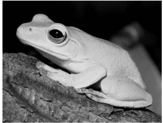
Abbildung 2: Der Nepal-Flugfrosch, Rhacophorus maximus , neu für Vietnam nachgewiesen.

Doch nicht nur die Fahndung nach neuen Arten steht auf dem Programm: Auch bereits bekannte Arten bergen Überraschungen, indem sie weit von ihren bisher bekannten Arealen gefunden und nachgewiesen werden können und damit interessante Probleme historischer Bio-